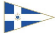
Lega Navale Italiana Portici